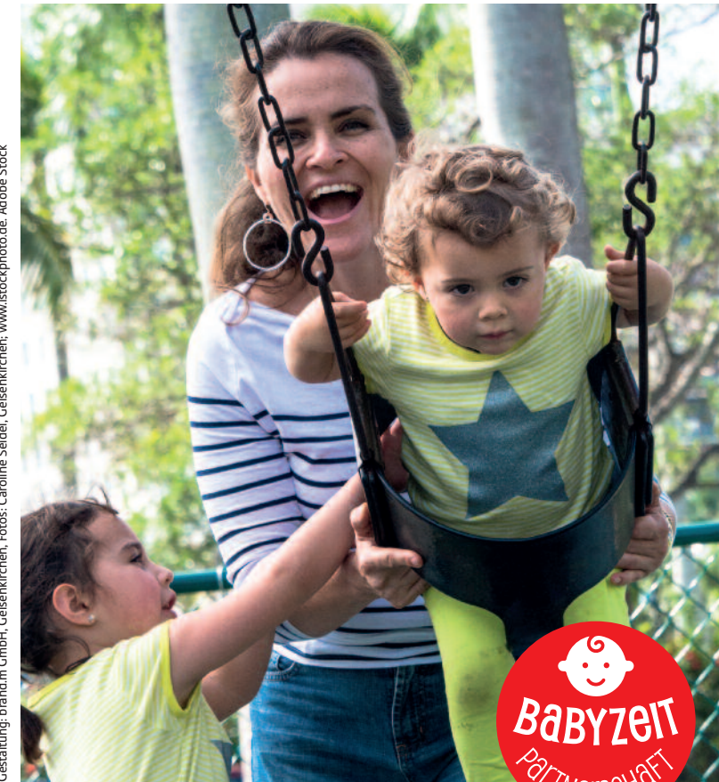
Gestaltung: brand.m GmbH, Gelsenkirchen, Fotos: Caroline Seidel, Gelsenkirchen, www.istockphoto.de, Adobe Stock

Ehrenamtsagentur Gelsenkirchen e.V. Ahstraße 9 | 45879 Gelsenkirchen Tel. 0209 179 893 - 0 lena.uppenkamp@gelsenkirchen.de